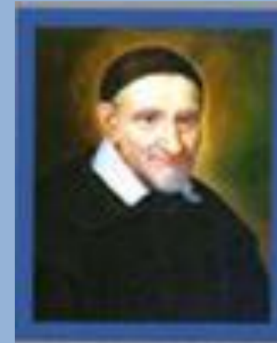
San Vincenzo De Paoli

Fondazione Federico Ozanam - San Vincenzo De Paoli Ente Morale - Onlus Bonifico bancario: Banca Prossima IBAN: IT18F0335901600100000013394